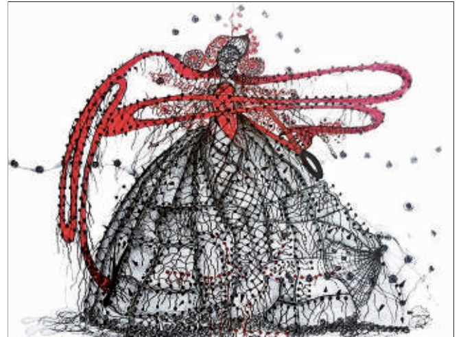
Ketten 2016-Zeichnung von Letitia Gaba 40x60 cm.

Im Jahr 2005 wurde der Internationale Künstlerverein (IKV e.V.) in Köln mit der Zielsetzung gegründet, ein internationales Netzwerk zu schaffen, das einem weltweiten kulturellen und künstlerischen Austausch dient. So sieht der IKV seine zentrale Aufgabe vor allem in der aktiven Suche eines grenzüberschreitenden, interkulturellen Dialogs sowie in der Förderung und Realisierung von Kunst-Projekten, Ausstellungen oder Workshops weltweit. Inzwischen haben sich im IKV Künstler aus aller Welt zusammen geschlossen. Aktuell verfügt der Internationale Künstlerverein über einen Verbund von 47 Mitgliedern aus 16 Nationen. Mehr unter: