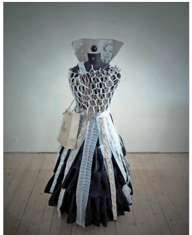
Starving 2013-Installation-Anna von der Heiden- Schneiderpuppe, Materialmix - 170/85x50cm.